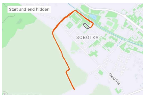
(Obrázok č. 3 Hobby run)

Každý účastník štartuje na vlastnú zodpovednosť. Organizátor nepreberá zodpovednosť za škody na majetku alebo na zdraví súvisiace s cestou, pobytom a s účasťou pretekárov na podujatí.