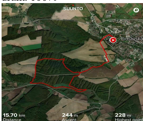
(Obrázok č. 1 Hlavný beh)